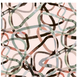
550.04.01 - 550.04.03 alle auch als Rapport in verschiedenen Motiv- größen